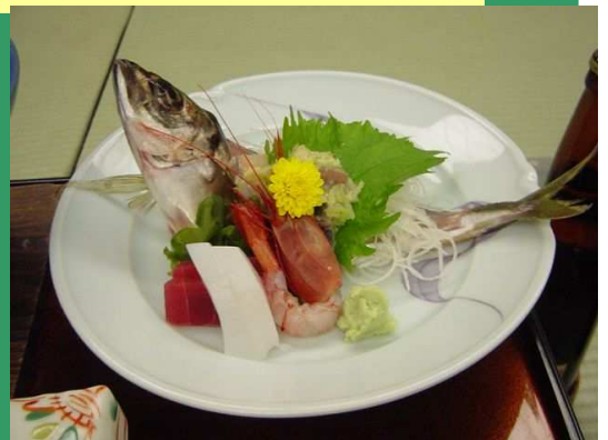
(定番！刺身も映えます。)