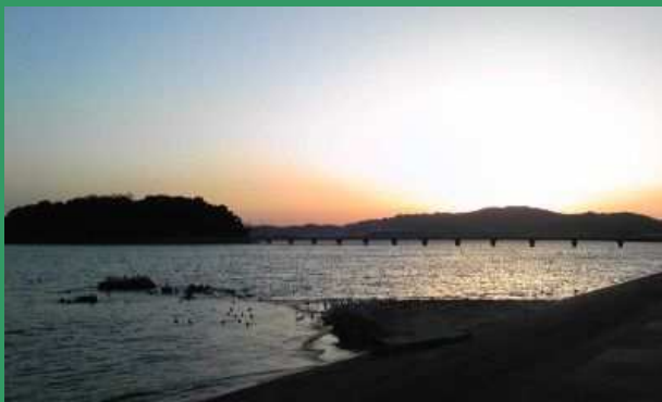
三河蒲郡、竹島の風景